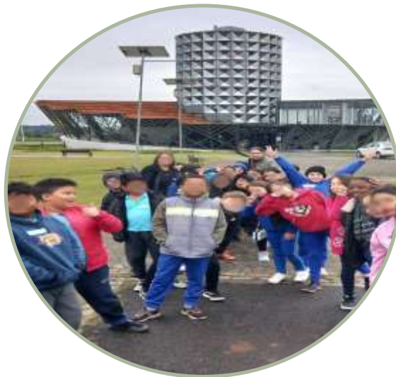
Aula de campo no Memorial do Iguazu Turma 5º A manhã